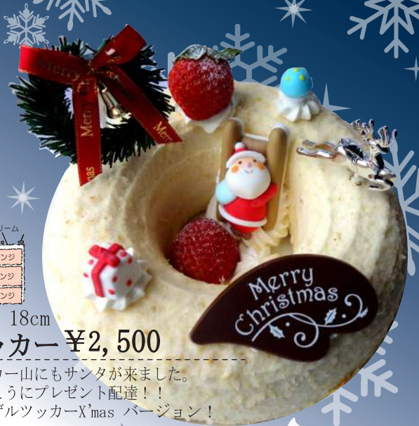
18cm ツッカー ¥2,500

生クリーム フルーツ スポンジ 練乳のムース スポンジ クレープ 練乳のムースとスポンジに、カスタードクリームと生クリームをのせクレープで包んで、フルーツを ふんだんに。