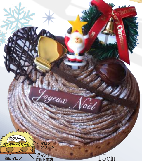
15cm モンブラン ¥3,700

バタークリーム スポンジ スポンジ スポンジ ツッカー山にもサンタが来ました。谷向こうにプレゼント配達!! ホーゲルトツッカーX'mas バージョン!