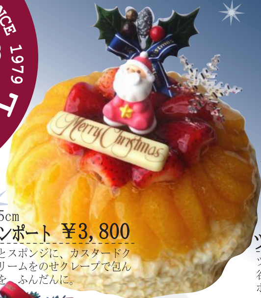
15cm フルーツコンポート ¥3,800

表も見てね SINCE 1979 全13種類!! TEL (079) 431-7633 FAX (079) 451-6021 ご予約は TEL・FAXでも承ります!! H O U G E I