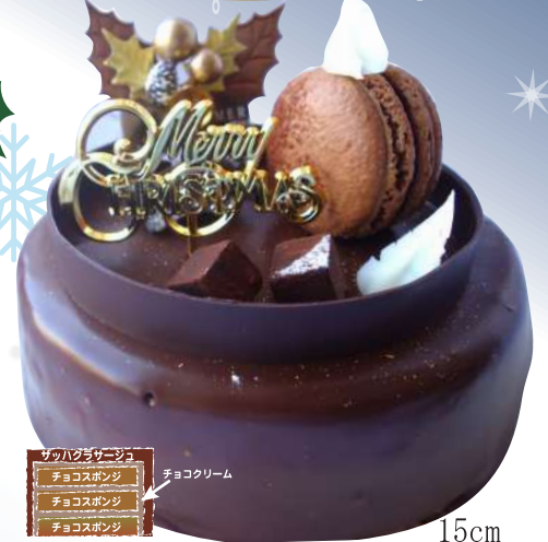
15cm ザットトルテ ¥3,700

生クリーム スポンジクラム マスカルポネームース バイクドチーズ クッキークラム 濃厚なバイクドチーズと、マスカルポネのムースが2層になって、うなる美味さ。