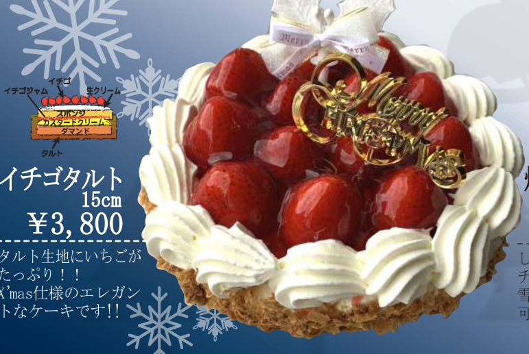
15cm イチゴタルト ¥3,800

サクハジラージュ チョコスポンジ チョコスポンジ チョコクリーム チョコスポンジ チョコスポンジ チョコスポンジ チョコスポンジに チョコクリームをサンドしてベルギーチョコをコーティング。お洒落な大人のX'mas